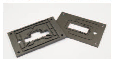
Pièces de fabrication