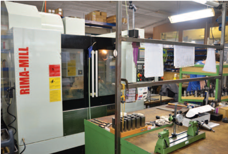
Place de travail

maines de la construction de machines, des techniques nucléaires, le bâtiment et la branche de la musique en fabriquant des valves pour des trombones. De plus en plus, elle construit aussi des groupes de construction, par exemple des outils à air comprimé ou de manipulation pour des robots. Elle fabrique des prototypes, des petites séries et, pour certaines pièces, des séries de taille moyenne. L'équipe apprécie de pouvoir participer activement à la conception des pièces où le savoir faire acquis pendant des années est un atout pour des réalisations rationnelles et efficaces. C'est un service que les clients et les développeurs apprécient particulièrement.